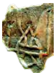
Цеглина з руїн Десятинної церкви, з гербовим знаком, як на монетах Володимира, X ст.