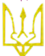
Тризуб Володимира Великого (980–1015)