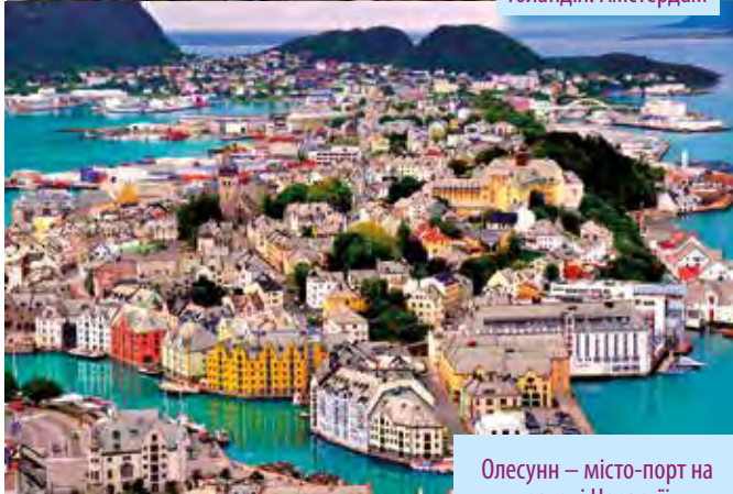
Олесунн – місто-порт на заході Норвегії