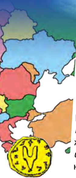
Печатка Святослава Ігоровича (957–972)