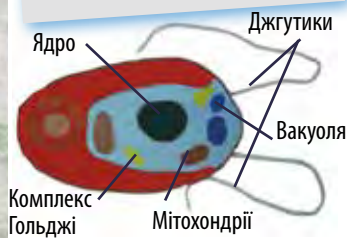
Будова хламідомонади сніжної

Червоний сніг називають кавуновим не лише через колір, але й через те, що його аромат та навіть смак нагадує цю найбільшу ягоду світу. Але не забувай, що їсти сніг – погана ідея. Водорості можуть виробляти токсини, які викликають отруєння.