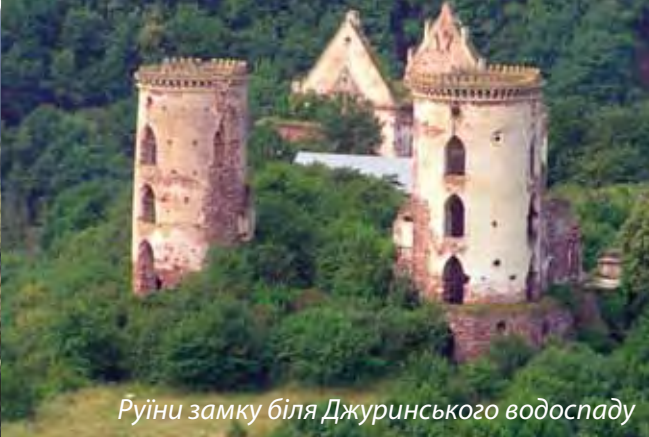
Руїни замку біля Джуринського водоспаду