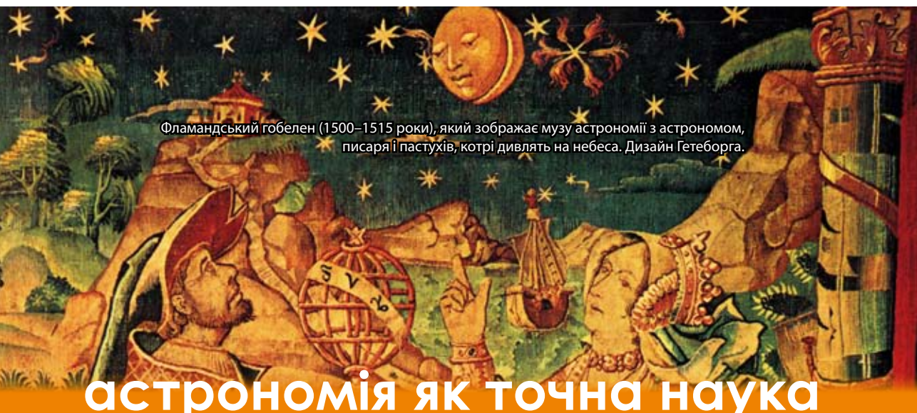
Фламандський гобелен (1500–1515 роки), який зображає музу астрономії з астрономом, писаря і пастухів, котрі дивлять на небеса. Дизайн Гетеборга.