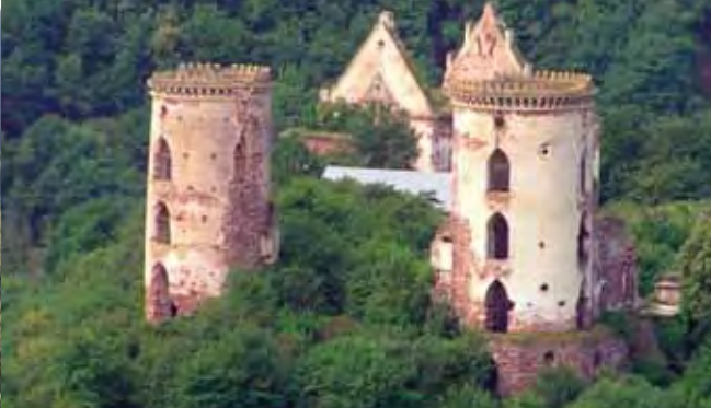
Руїни замку біля Джуринського водоспаду