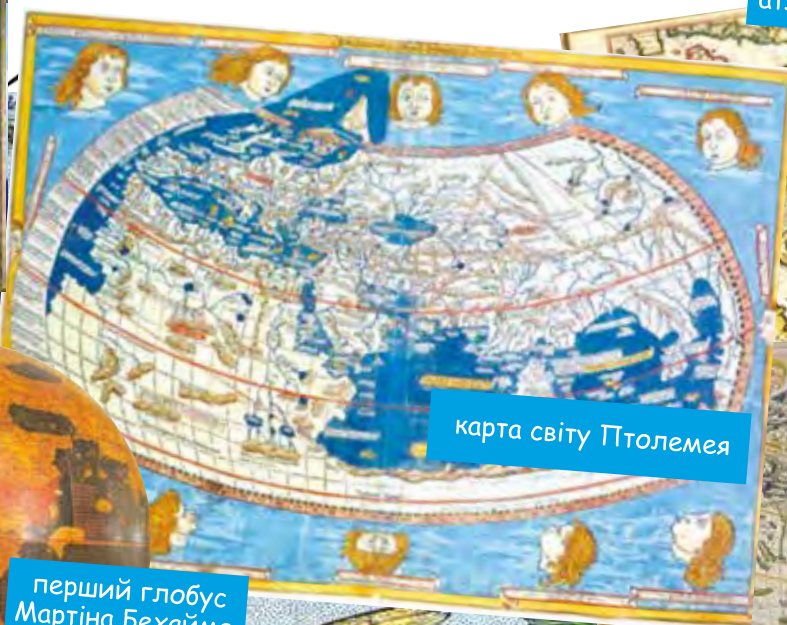
карта світу Птолемея