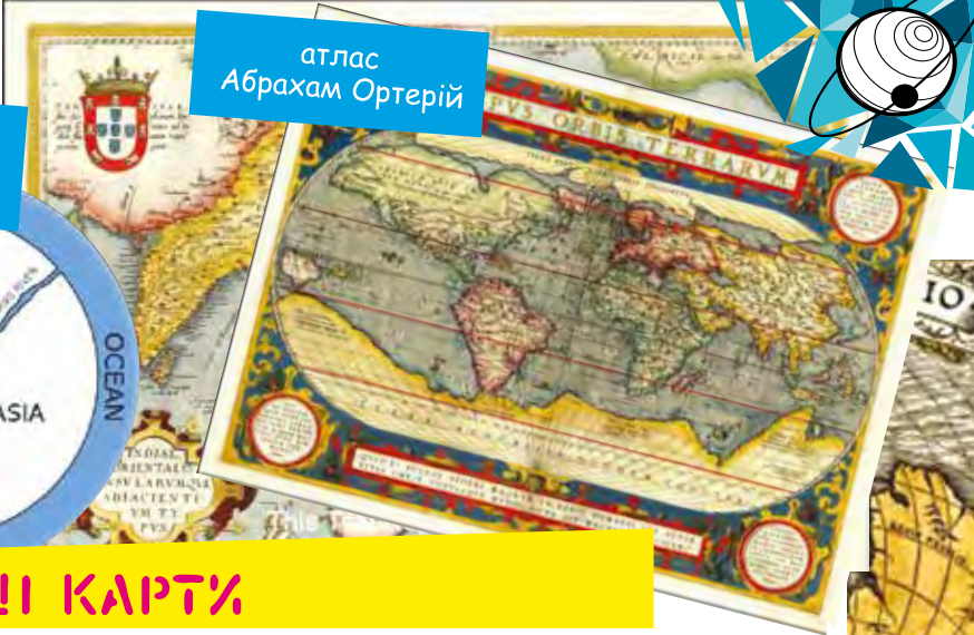
атлас Абрахам Ортерій

Про географічну карту кажуть, що це „друга мова“ географії. Створив першу географічну карту ще у VI ст. до н. е. давньогрецький вчений Анаксимандр . Він накреслив карту відомого тоді світу, зобразивши Землю плоскою у формі круга, оточеного водою. Збірник карт тепер називають атласом. Перший географічний атлас створив у 1570 році голландський картограф Абрахам Ортелій . Його атлас нараховував 70 карт великого формату із пояснювальним текстом. Термін „атлас“ вперше використав фламандський картограф Герард Меркатор , який і видав у 1595 році „Атлас“. У 1492 році німецький географ Мартін Бехайм виготовив перший глобус діаметром 0,54 м, який назвали „Земне яблуко“. Основою для глобуса була карта світу Птолемея.