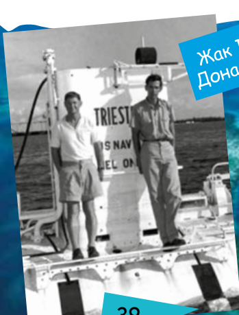
Жак Пікар та Дональд Уолш

У 1957 р. експедиція на кораблі „Витязь“ відкрила найглибшу западину Світового океану – Маріанський жолоб у Тихому океані, глибина якого становить 10994 м. Першими у 1960 р. на дно цієї западини спустилися в батискафі „Трієст“ і провели дослідження швейцарець Жак Пікар та американець Дональд Уолш .