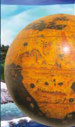
перший глобус Мартіна Бехайма Анаксимандира