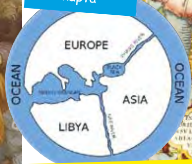
перша географічна карта