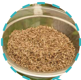
Сушена стружка цукрових буряків

Спочатку корені буряка були невеликими і жорсткими, мали низьку цукристість. Зараз завдяки селекції буряк став основною цукроносною сільськогосподарською культурою в Україні.