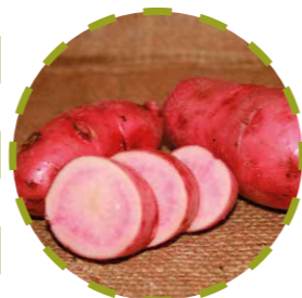
Червона картопля „Великий палець”