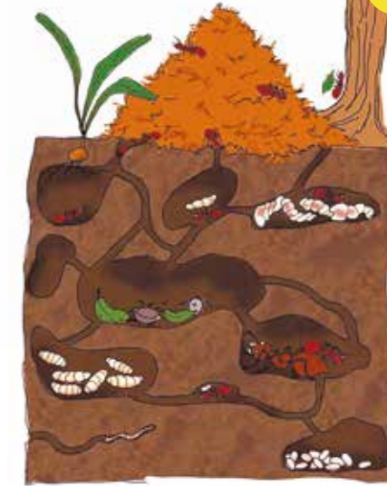
Схема облаштування мурашника

Будівельними роботами в гнізді займаються лише робочі мурашки, головним знаряддям праці яких є могутні щелепи. Робочі мурашки славляться своєю солідарністю, допомагають одне одному, діють спільно. Обов'язок солдатів – охорона мурашника. Коли трапиться велика жертва, солдати гуртом розривають її на шматочки.