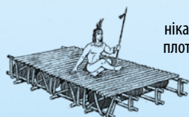
Модель нікарагуанського плота на гарбузах