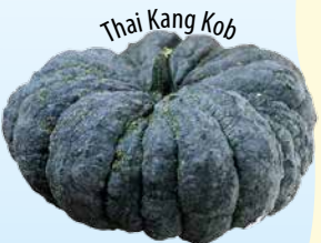
Thai Kang Kob