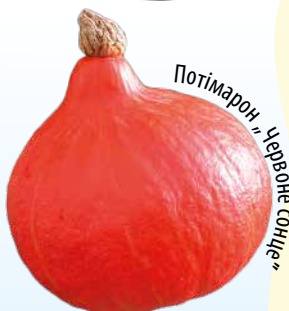
Потімарон „Червоне Сонце“