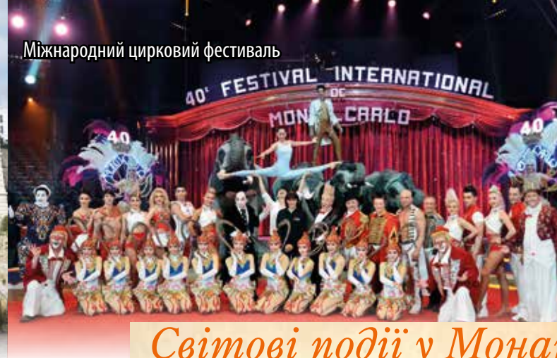
Міжнародний цирковий фестиваль