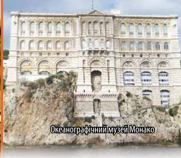
Океанографічний музей Монако