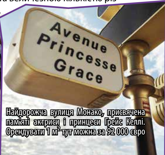
Найдорожча вулиця Монако, присвячена пам'яті актриси і принцеси Грейс Келлі. Орендувати 1 м 2 тут можна за 92 000 євро