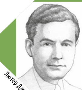
Лютер Джордж Симджян

Прототип першого банкомата винайшов Лютер Джордж Симджян ще у 1939 році. Пристрій видавав готівку, але не списував гроші з рахунку, бо не був з'єднаний із банком. Симджян запропонував випробувати винахід City Bank of New York, але через півроку банкіри повернули машину, повідомивши, що в ній немає потреби. Продовжив історію банкоматів виконавчий директор англійської фірми De La Rue Джон Шеферд-Беррон. Він проживав у передмісті Лондона, де відділення банку у вихідні дні працювало лише до обіду, і місцеві мешканці не завжди встигали отримати готівку. Якось винахіднику спала на думку ідея автоматизувати видачу банкоматом клієнтам банку. Як це не дивно, але прообразом майбутнього винаходу був автомат із продажу шоколадних батончиків.