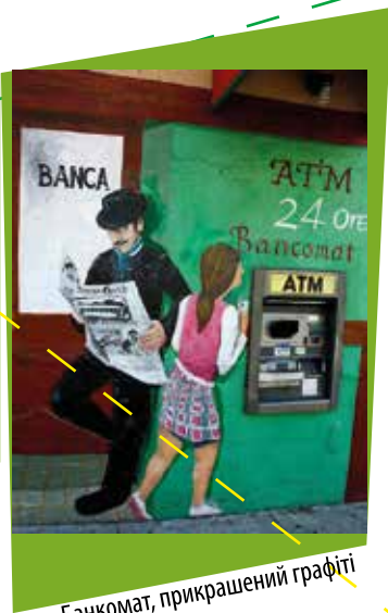
Банкомат, прикрашений графіті

На початку 1970-х японська компанія Omron створила перший у світі online-банкмат. Він виявився зручним у використанні, бо тепер клієнт міг дізнатися залишок на рахунку і здійснювати інші операції, але користуючись банкоматами лише свого банку. У середині 1980-х кілька американських банків вперше об'єднали свої банкоматні мережі в єдину систему.