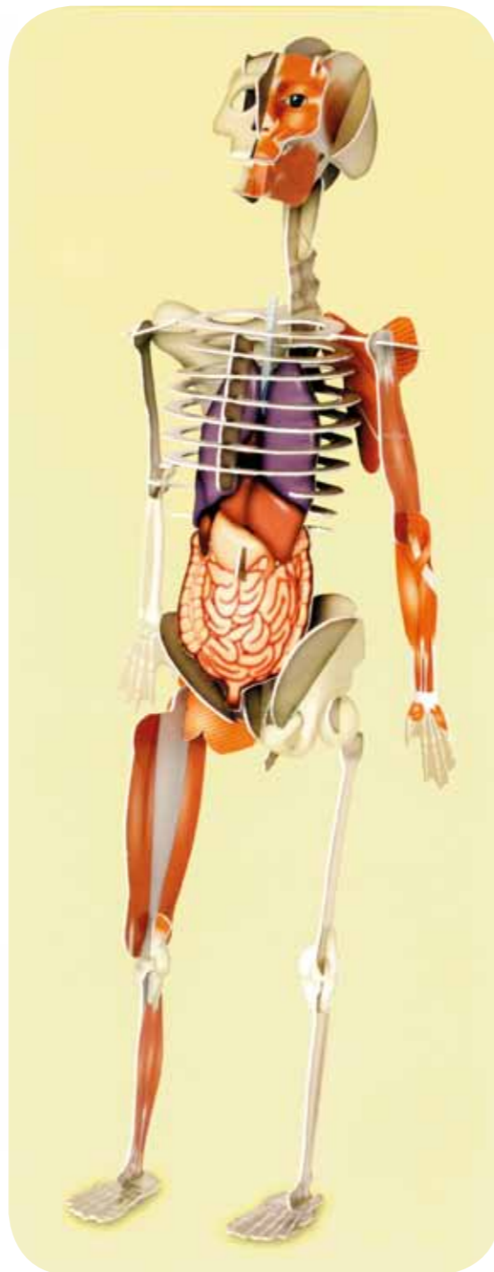
Повністю складена тривимірна модель.

Щоб взяти участь у II заочному Чемпіонаті України юних шанувальників природознавства передплати газету „КОЛОСОЧОК” на 2015 рік.