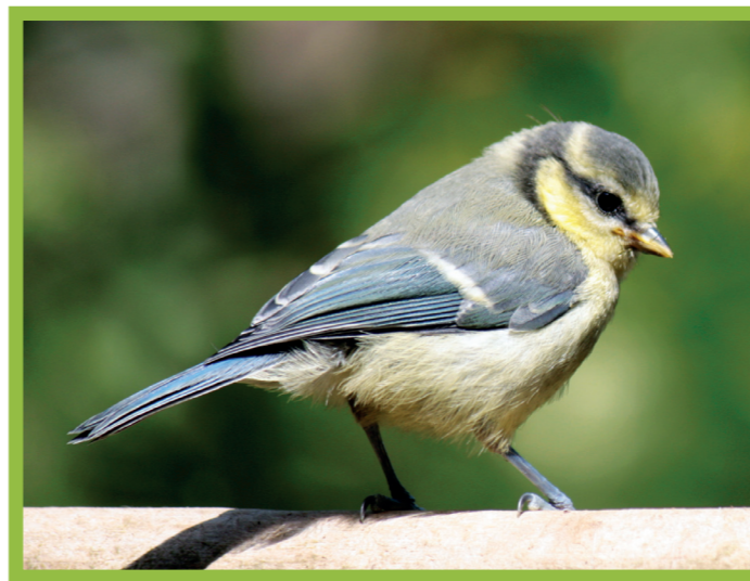
ПТАШЕНЯ БЛАКИТНОЇ СИНИЦІ

ЗНАЙДИ ПОДІБНІСТЬ ТА ВІДМІННІСТЬ У ЗАБАРВЛЕННІ ПТАШЕНЯТ І ДОРОСЛИХ ПТАХІВ