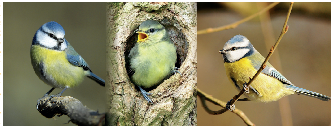
ФОТО ПО ЛЮ В А Н Н Я