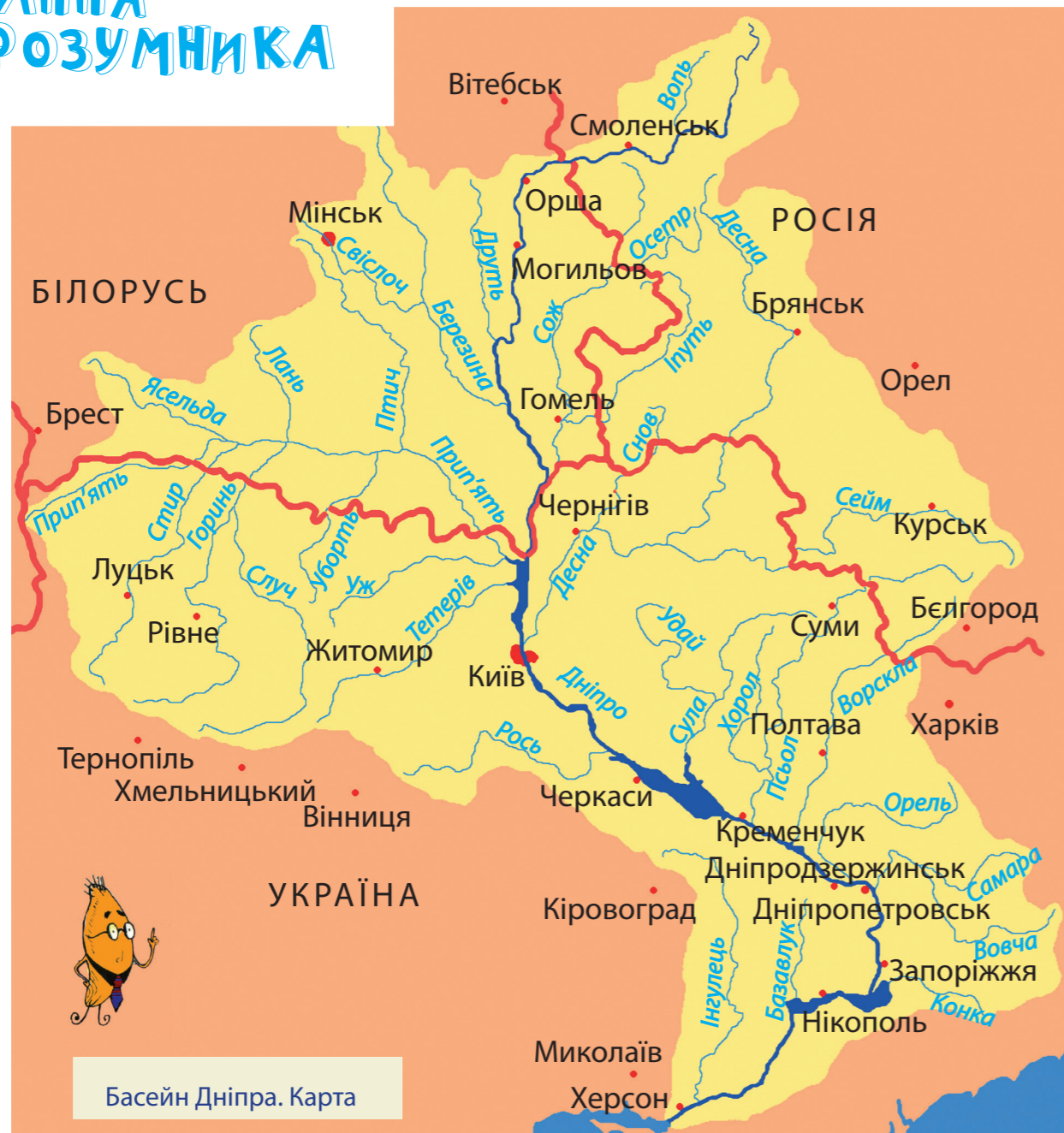
Басейн Дніпра. Карта