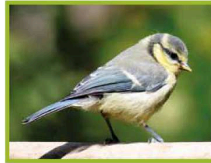
ПТАШЕНЯ БЛАКИТНОЇ СИНИЦІ

ЗНАЙДИ ПОДІБНІСТЬ ТА ВІДМІННІСТЬ У ЗАБАРВЛЕННІ ПТАШЕНЯТ І ДОРОСЛИХ ПТАХІВ