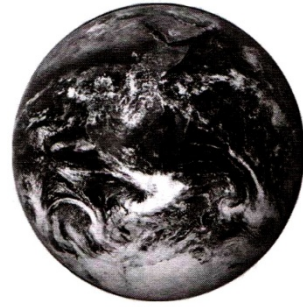
Вигляд Землі з космосу