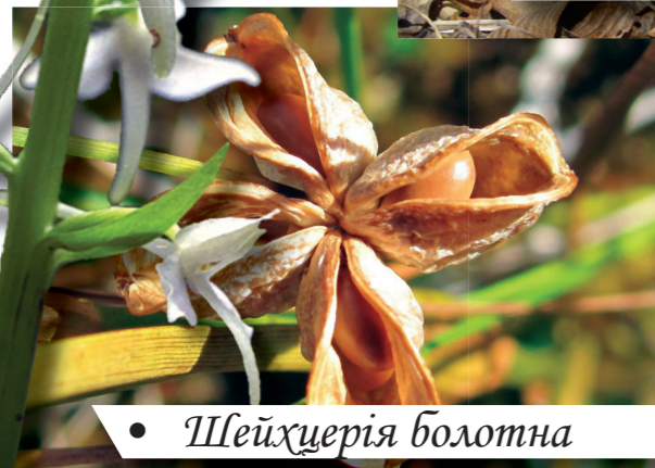
• Шейхцерія болотна