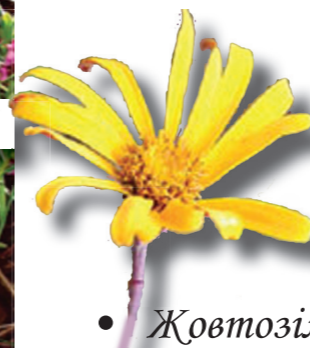
• Жовтозілля қарпатське