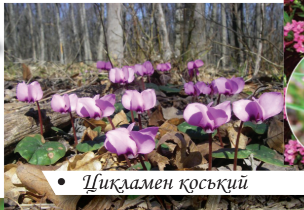
• Цицламен қоський