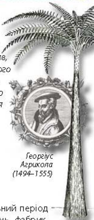
Георгіус Агрикола (1494–1555)