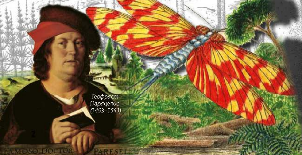
Теофраст Парацельс (1493–1541)

Перенесімося на 300–360 млн. років назад у кам'яновугільний період (карбон). Як виглядав тоді Донецький басейн? Не було копалень, фабрик, металургійних комбінатів, до яких ми звикли. Тут панувало царство гігантських рослин і тварин. У болотистих низинах і котловинах, які простягалися біля підніжжя гір, за надзвичайно сприятливих умов виросла розкішна рослинність.