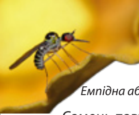
Емпідна або „танцююча муха”