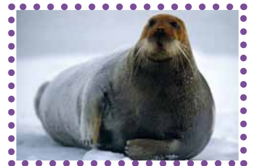
Морський заєць, лахтак

Деколи назви тварин можуть нас здивувати. Знайомтеся – морський заєць . Чому заєць? Це ж справжній тюлень! Довжина його тіла сягає понад 2 м, а якщо його охопити вимірною стрічкою попід пахвами – 148–161 см. Він має ласти і потужні щелепи, а зуби – дрібні і слабкі. Живе він на узбережжі Північного Льодовитого океану.