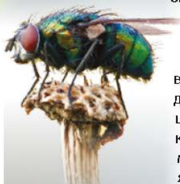
Мал. 2. Усе тіло мухи вкрите волосками

Комахи також сприймають коливання поверхні. Більшість з них вловлює вібрації так само, як і павуки, – волосками. Розгляньте фотографію мухи (мал. 2). Радимо вам зловити муху і розглянути її під шкільним мікроскопом. Ви будете здивовані: волосками вкрито не лише все її тіло, але й крильця мухи!