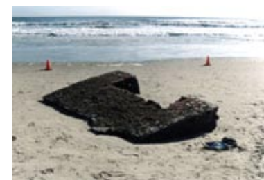
Після вибуху космічного корабля „Челленджер” у 1986 році великий уламок апарату майже 11 років плавав у океані, поки його не винесло на берег одного із пляжів штату Флорида

Захист від частинок розміром 0,1–1 см здійснюється шляхом застосування екранних конструкцій, а від частинок розміром понад 1 см – шляхом розташування життєво важли-