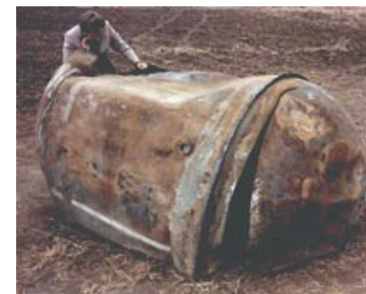
250-кілограмовий резервуар РН „Delta” не згорів у атмосфері (Саудівська Аравія, 1997 р.)