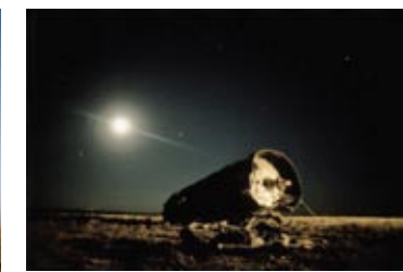
Залишки від запусків РН і КА в районі космодрому Байконур (Казахстан)

вих систем у так званих мертвих зонах щодо напрямку удару потоком сміття. Щодо екранних конструкцій, то вони бувають різного типу: це і прості одношарові виносні екрани, що розміщуються перед корпусом апарата, і складні багатошарові конструкції з металу й кераміки. Хвостову частину орбітального ступеня кораблів серії „Шатл” орієнтують у напрямі руху. Роботи у відкритому космосі планують так, щоб космонавта захищав корпус станції.