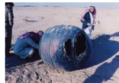
Моторний кожух двигуна 3-го ступеня РН „Delta” вагою близько 70 кг упав за 240 км від м. Ер-Ріяд (Саудівська Аравія, 2001 р.)