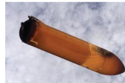
Зовнішній паливний резервуар орбітального апарату „Союз-2” падає на Землю після відділення від космічного корабля (США, 4 січня 2007 р.)

Першим успіхом у боротьбі з космічним сміттям є вироблення нових міжнародних стандартів. Тепер на борту супутників повинні бути резервні запаси палива, щоб після завершення терміну роботи відвести апарати у визначені райони навколосемних