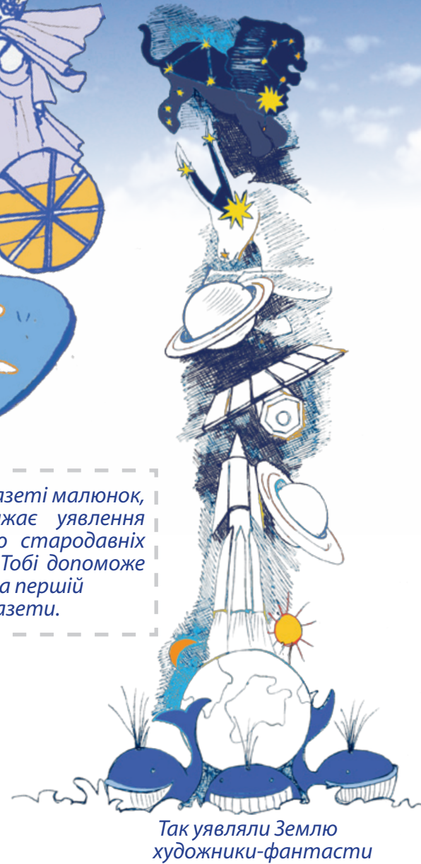
Так уявляли Землю художники-фантасти

Знайди в газеті малюнок, що зображає уявлення про Землю стародавніх єгиптян. Тобі допоможе стаття на першій сторінці газети.