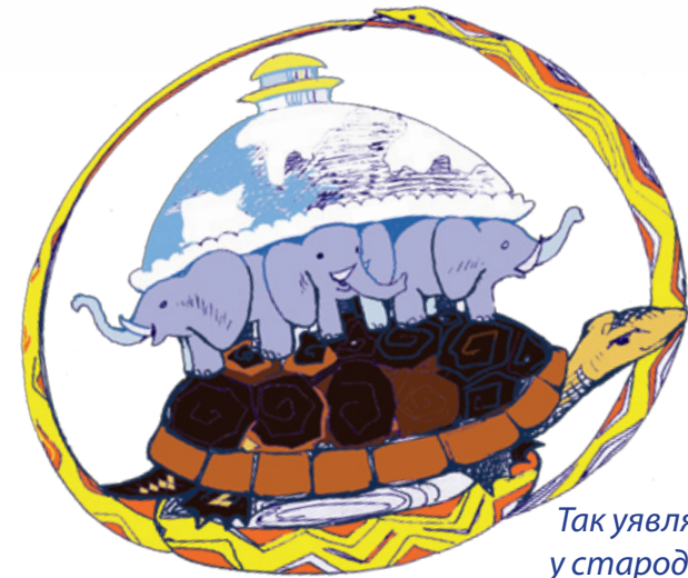
Так уявляли Землю у стародавній Індії

Знайди в газеті малюнок, що зображає уявлення про Землю стародавніх єгиптян. Тобі допоможе стаття на першій сторінці газети.