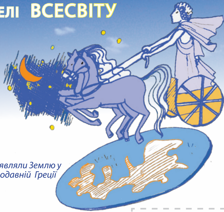
Так уявляли Землю у стародавній Греції