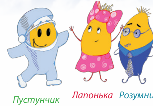
Пустунчик Лапонька Розумник

Всесвіт безмежний. Наше Сонце – не єдина зоря у Всесвіті. Зірок, подібних на Сонце, у Всесвіті є безліч. А ще у Всесвіті є багато планетних систем, таких, як наша Сонячна система. Наука, яка вивчає будову Всесвіту, називається космологією.