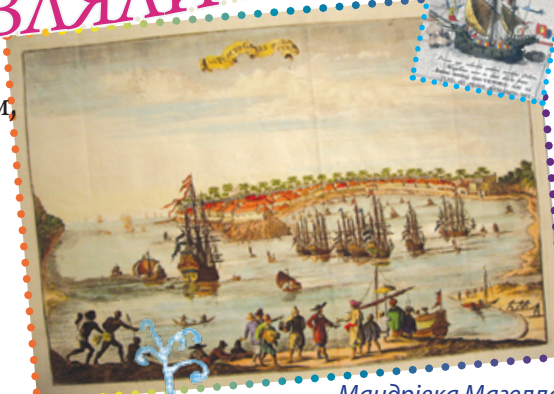
Мандрівка Магеллана навколо Землі