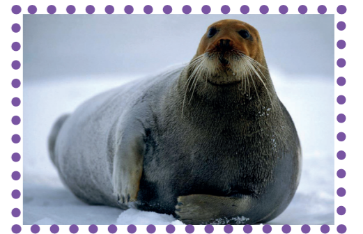
Морський заєць, лахтак

Деколи назви тварин можуть нас здивувати. Знайомтеся – морський заєць . Чому заєць? Це ж справжній тюлень! Довжина його тіла сягає понад 2 м, а якщо його охопити вимірною стрічкою попід пахвами – 148–161 см. Він має ласти і потужні щелепи, а зуби – дрібні і слабкі. Живе він на узбережжі Північного Льодовитого океану.