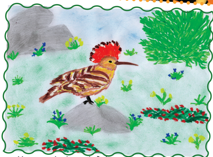
Малюнок Архіпова Андрія