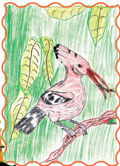
Малюнок Поліщука Максима