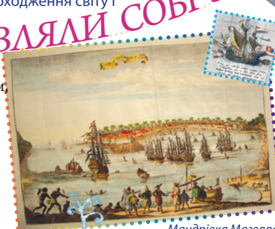
Мандрівка Магеллана навколо Землі